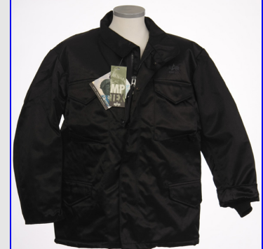
M65 Field jacket MPTex Made in USA